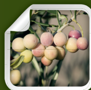
Imperial i-23 R