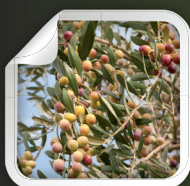
Arbequina i-21 R