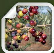
Arbosana i-43 R