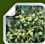
Koroneiki i-38 R

Estas plantações integram numa mesma plantação diferentes variedades de oliveira. Plantam-se em linha agrupadas por tipologias, formam-se em falsa palmeta criando linhas contínuas de oliveiras para que uma máquina colhedora as possa colher.